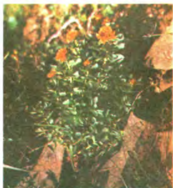
881. Родіола рожева.